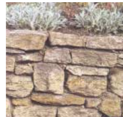
Požadované provedení kamenné zídky - malé spáry, nezřetelné spárování, koruna osázena rostlinami (foto č. 1)