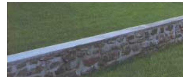
Kamenná zídka s velkými spárami a korunou z betonu (foto č. 2)